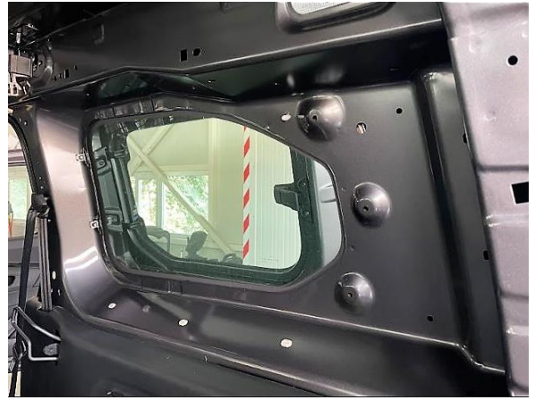
Салон та вантажне відділення