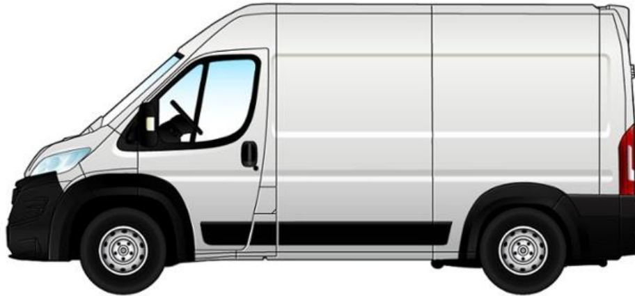
Габаритні розміри, мм

Забарвлення кузова пастельною фарбою білого кольору (код 549 – DUCATO BIANCO)