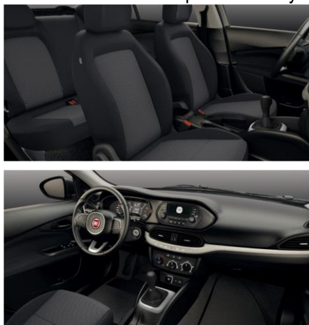
Тканинна обробка салону